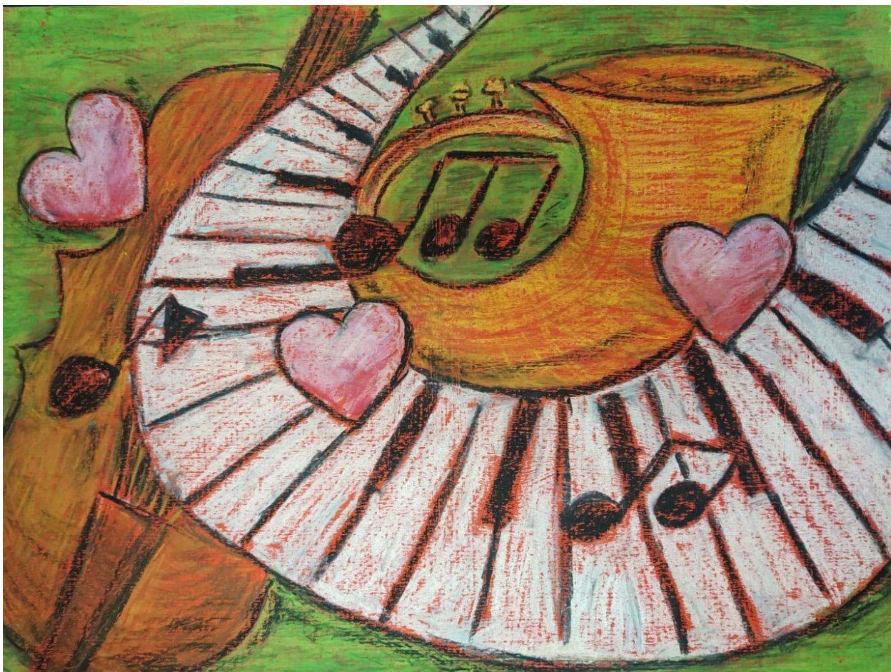
«Иллюстрация к симфонии № 4»